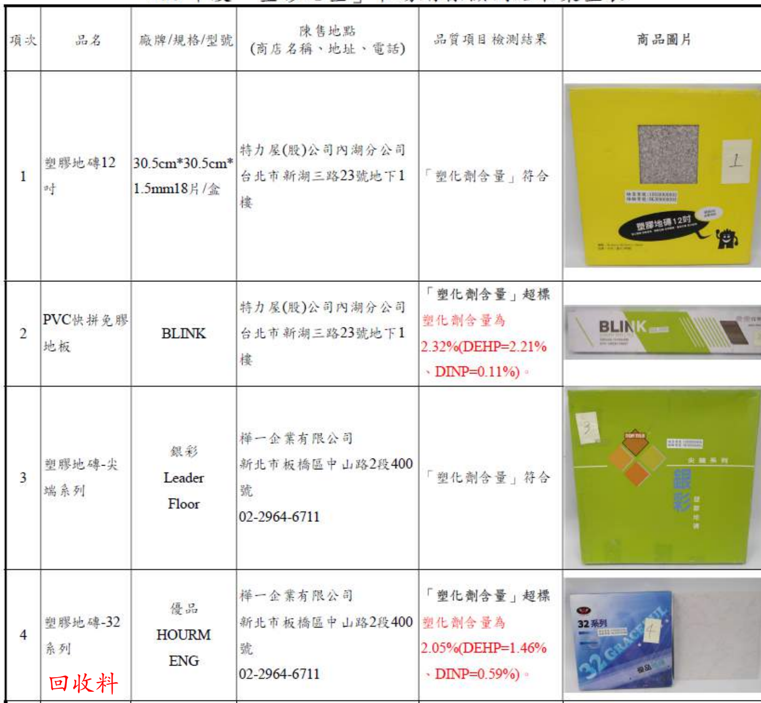
109 年度「塑膠地墊」市場購樣檢測結果彙整表