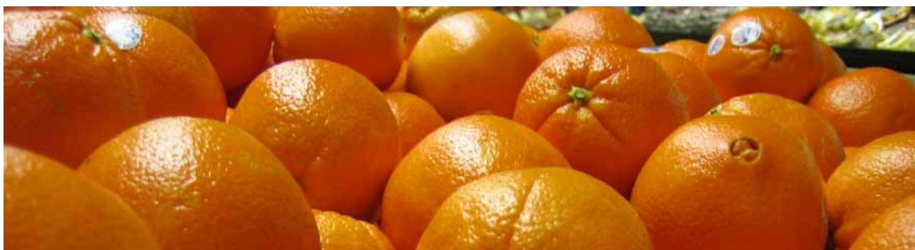
買賣這件事，還有其他可能性。