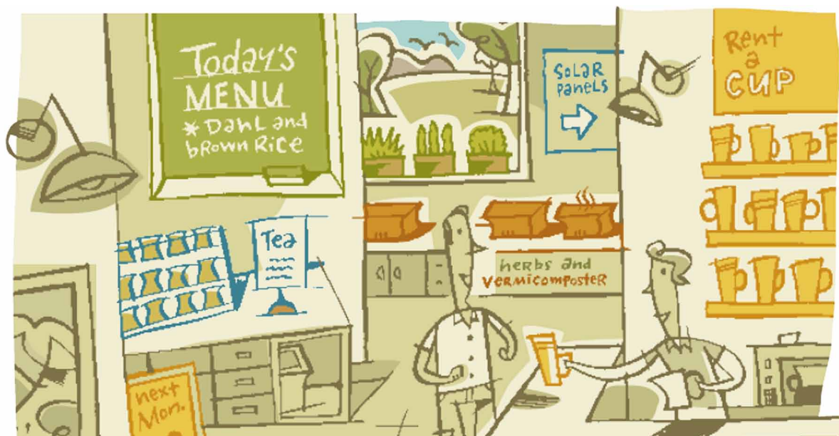
作者／艾利克·阿沙杜利安 (Erik Assadourian) 譯者／蔡孟庭