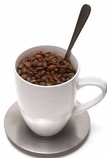
一杯咖啡怎麼生產出來？

利組織「活力地球倫理基金會」(Living Earth Ethics Foundation)推動的計畫，該基金會的宗旨是「提倡一套可以維繫生命的倫理守則，讓地球恢復生氣。」而這連鎖咖啡廳和該基金會其他以任務為導向的事業所獲得的利潤，都用來支持該基金會提供的社會服務，如：都市農園，可提供低收入市民技能訓練，並取得健康的食物；義診，除了推廣健康生活型態外，也藉此治療許多因消費文化而衍生的慢性病；流浪者收容所，強調對流浪者的培力，並提供成功的新模式（而非藉由增加物資消費來達到成功）；數間「活力地球特許學校」(Living Earth Charter Schools)，不像一般的學校，該校課程著重於建立環境意識，讓學生們認知到有限地球的自然限制，深刻了解到人類消費經濟和當前資源開發利用與環境的密切關係，灌輸學生們對於地球和其上所有生命的道德責任意識，同時儘可能提供高等的學術訓練。