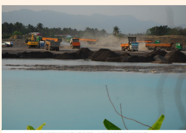
當中鋼爐渣進到水質水量保護區，中鋼爐渣再利用變成野蠻遊戲。