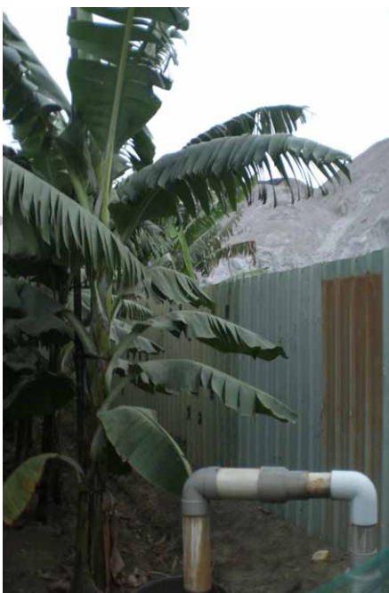
脫硫渣堆和旁邊的香蕉樹距離很近，香蕉樹葉上有少許灰粉，下方土地也有白粉殘留。

政府自97年1月至101年11月間，共計稽查263件次，其中該公司違反空氣污染防治法及廢棄物清理法等，共計告發處分51次，裁處金額為517萬4,400元。」不過仍無法有效迫使地勇公司改善現狀，把脫硫渣清走或賣出去。 註3